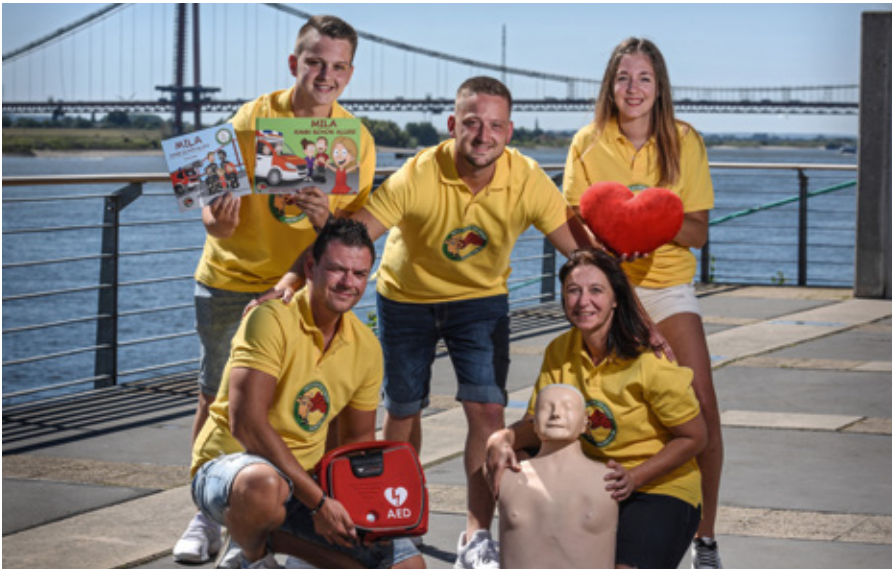
Das Team der Rennecke-Medic

Anmeldung für alle Kurse online auf unserer Webseite.