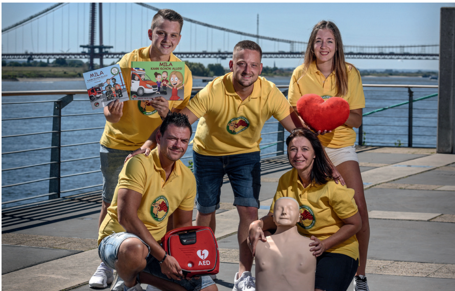
Das Team der Rennecke-Medic

Anmeldung für alle Kurse online auf unserer Webseite.